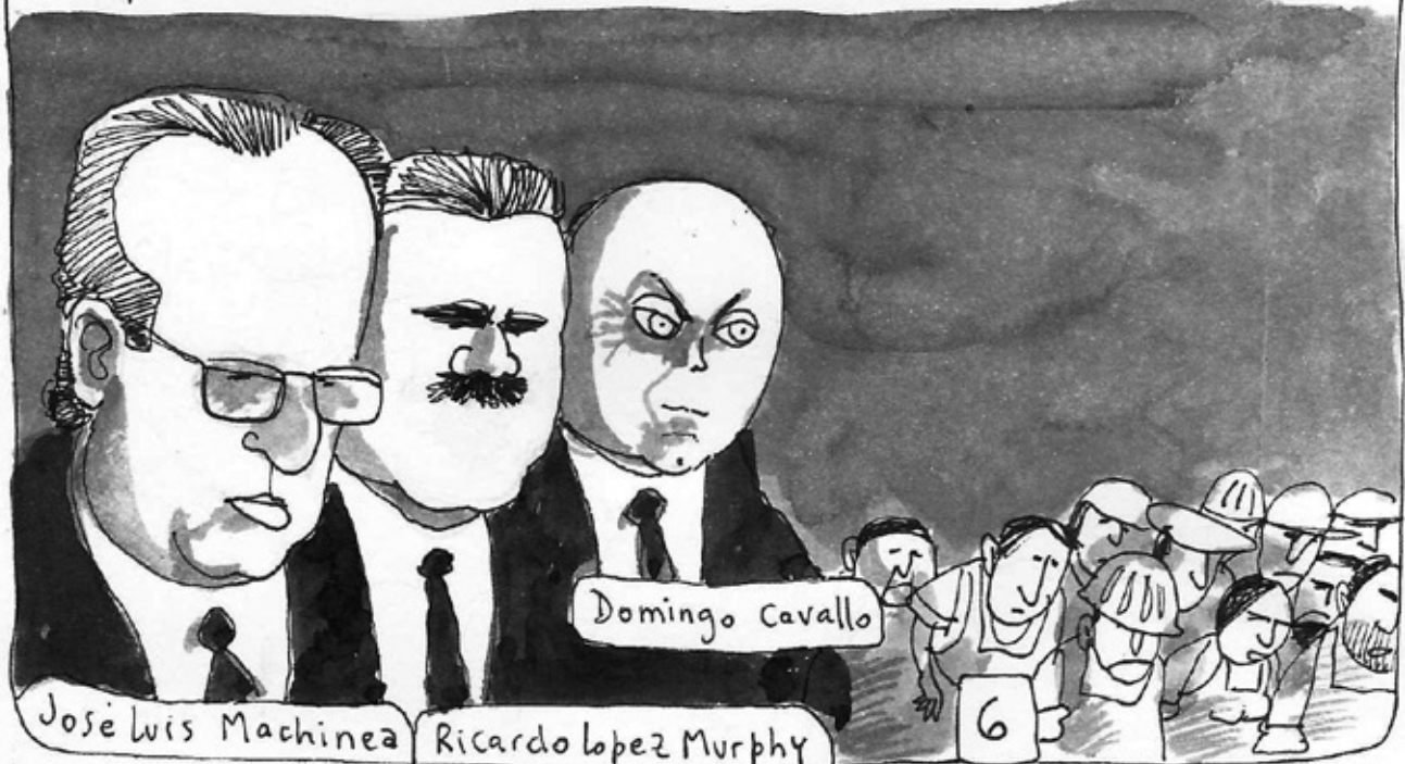
José Luis Machinea

De la Rúa gana las elecciones de 1999 con la promesa de honestidad y de mantener baja la inflación. Machinea, López Murphy, Cavallo garantizan la continuidad del ajuste. la "flexibilización laboral" se profundiza.